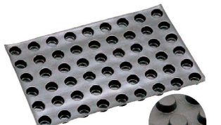
19 1129 プティフル(円) 54取 〈WHL-56〉 目 9-1105-1901 ¥31,000 600×400 出来上がり寸法:φ40×H20