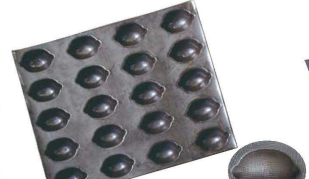
13 REF1529 レモン型 20取 〈WHL-76〉 目 9-1105-1301 ¥31,000 465×390 出来上がり寸法:84×55×H33