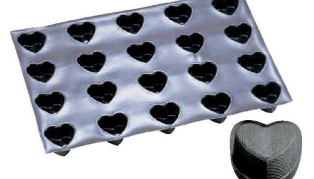
12 1340 ハート 20取 〈WHL-48〉 目 9-1105-1201 ¥31,000 600×400 出来上がり寸法:66×62×H35