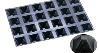
11 1585 ピラミッド 24取 〈WHL-46〉 目 9-1105-1101 ¥31,000 600×400 出来上がり寸法:71×71×H41