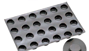
18 2269 バヴァロワ(円柱) 24取 〈WHL-55〉 目 9-1105-1801 ¥31,000 600×400 出来上がり寸法:φ63×H25