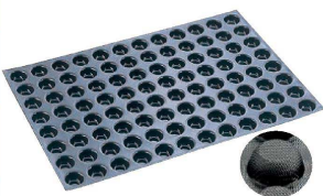
1 1416 ポンポネット 96取 〈WHL-36〉 目 9-1105-0101 ¥31,000 600×400 出来上がり寸法:φ36×H17

●焦げ付きがほとんどないので、食器を洗うようにさっと洗って乾燥させればOK。従来の型よりも衛生的です。