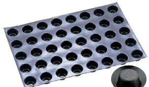
8 1031 ミニマフィン(円) 40取 〈WHL-43〉 目 9-1105-0801 ¥31,000 600×400 出来上がり寸法:φ51×H29