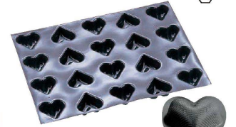
15 1073 立体ハート 20取 〈WHL-49〉 目 9-1105-1501 ¥31,000 600×400 出来上がり寸法:75×65×H35