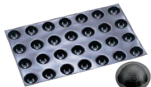
5 1896 プティ・ガトー(半球) 28取 〈WHL-40〉 目 9-1105-0501 ¥31,000 600×400 出来上がり寸法:φ58×H31