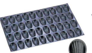
14 1511 マドレーヌ 40取 〈WHL-47〉 目 9-1105-1401 ¥31,000 600×370 出来上がり寸法:78×47×H19