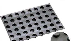
17 2266 プティフル(円) 48取 〈WHL-54〉 目 9-1105-1701 ¥31,000 600×400 出来上がり寸法:φ40×H20