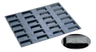
10 1264 フィナンシェ 24取 〈WHL-45〉 目 9-1105-1001 ¥31,000 600×400 出来上がり寸法:86×46×H14