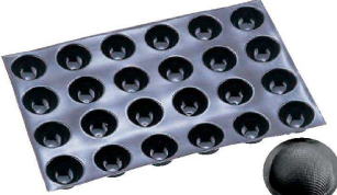
7 1268 プティ・ガトー(半球) 24取 〈WHL-42〉 目 9-1105-0701 ¥31,000 600×400 出来上がり寸法:φ70×H40