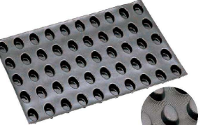
16 2267 プティフル(楕円) 50取 〈WHL-53〉 目 9-1105-1601 ¥31,000 600×400 出来上がり寸法:51×31×H20