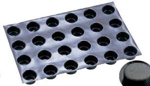
6 1269 バヴァロア(円柱) 24取 〈WHL-41〉 目 9-1105-0601 ¥31,000 600×400 出来上がり寸法:φ63×H35