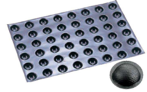
4 1489 プティ・ガトー(半球) 48取 〈WHL-39〉 目 9-1105-0401 ¥31,000 600×400 出来上がり寸法:φ42×H21