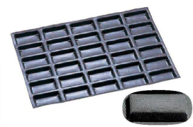
9 1536 フィナンシェ 30取 〈WHL-44〉 目 9-1105-0901 ¥30,000 500×340 出来上がり寸法:81×41×H14