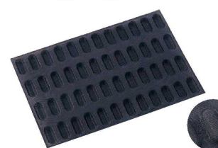
14 ミニプリオッシュ 48取 1070 〈WDM-07〉 目 9-1107-1401 ¥16,200 600×400 出来上がり寸法:70×30×H10