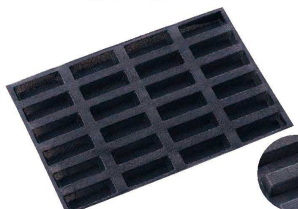
13 プリオッシュ(長方形)24取 1145 〈WDM-11〉 目 9-1107-1301 ¥15,200 600×400 出来上がり寸法:120×40×H25