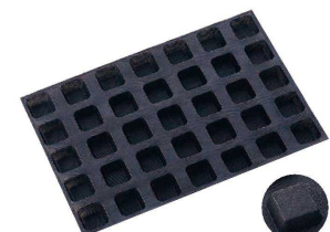
10 パンズ・カレ(正方形)35取 1133 〈WDM-10〉 目 9-1107-1001 ¥15,200 600×300 出来上がり寸法:56×56×H24