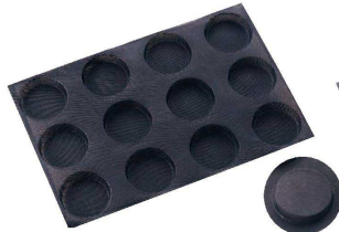
4 ロンド(円)12取 1217 〈WDM-12〉 目 9-1107-0401 ¥15,200 600×400 出来上がり寸法:φ104×H20