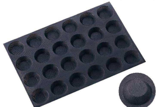
8 タルトレット(円)24取 1675 〈WDM-14〉 目 9-1107-0801 ¥16,600 600×400 出来上がり寸法:φ77×H20