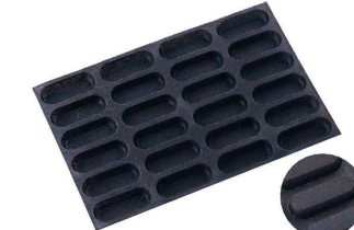
12 プリオッシュ(楕円)24取 2005 〈WDM-15〉 目 9-1107-1201 ¥15,200 600×400 出来上がり寸法:130×48×H18