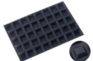
9 カレ 40取 1119 〈WDM-09〉 目 9-1107-0901 ¥15,200 600×400 出来上がり寸法:60×60×H15