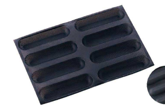
15 ミニバゲット 8取 0167 〈WDM-06〉 目 9-1107-1501 ¥16,300 600×400 出来上がり寸法:259×64×H30