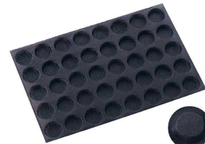
7 ミニフロランタン 40取 0115 〈WDM-05〉 目 9-1107-0701 ¥16,600 600×400 出来上がり寸法:φ59×H13