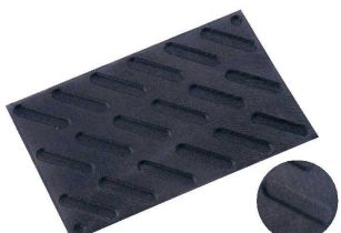
11 エクレア 18取 1090 〈WDM-08〉 目 9-1107-1101 ¥16,600 600×400 出来上がり寸法:125×25×H5