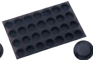
5 ロンド(円)28取 0002 〈WDM-03〉 目 9-1107-0501 ¥16,600 600×400 出来上がり寸法:φ67×H15