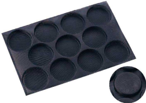
3 ロンド(円)11取 0107 〈WDM-04〉 目 9-1107-0301 ¥16,600 600×400 出来上がり寸法:φ125×H16