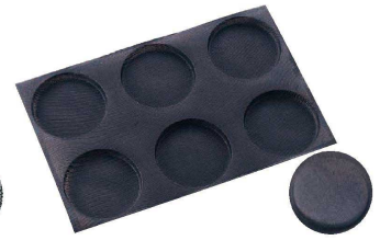
2 ロンド(円)6取 1548 〈WDM-13〉 目 9-1107-0201 ¥16,600 600×400 出来上がり寸法:φ150×H15