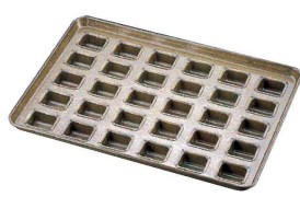
1 シリコン加工 ホール型 天板 (30ヶ取) 〈WTV-32〉 9-1112-0101 ¥38,500 542×393×H53 単品寸法 (A) (B) (H) 内 52×42×30