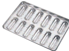
8 シリコン加工 シュトーレン 天板 12連 〈WTV-B4〉 9-1112-0801 ¥34,500 545×395×H57 単品寸法 (A) (B) (H) 内 160×53×35