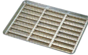
2 シリコン加工 ラフト型 天板 (24ヶ取) 〈WTV-70〉 9-1112-0201 ¥36,500 545×395×H38 単品寸法 (A) (B) (H) 内 150×26×18