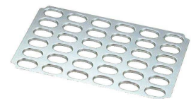
9 マトファ ダコワーズ 791749 (アルミ) 〈WDK-14〉 9-1112-0901 ¥14,500 500×360×H8 (1ヶ当たり 内 60×40)