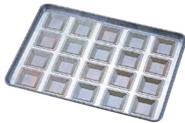
4 シリコン加工 カトラ型 70型 天板 20連 〈WTV-79〉 9-1112-0401 ¥31,500 545×395×H34 単品寸法 (A) (B) (H) 内 70×70×12