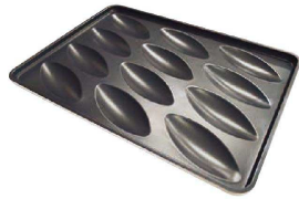
12 塩パン型天板 6枚取 PYJ006 〈WTV-C4〉 9-1112-1201 ¥8,800 530×380×H33 (1ヶ当たり 内170×66×H15) 材質: アルミメッキ鋼板(フッ素加工)