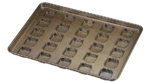
6 シリコン加工 サボン型 天板 (25ヶ取) 〈WTV-13〉 9-1112-0601 ¥33,500 545×395×H39 単品寸法 (A) (B) (H) 内 54×54×15