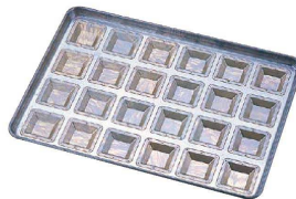
5 シリコン加工 カトラ型 60型 天板 24連 〈WTV-80〉 9-1112-0501 ¥33,000 545×395×H34 単品寸法 (A) (B) (H) 内 60×60×12