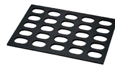
11 ゴム製 小判ダコワーズ 〈WDK-24〉 1ヶ当たり 9-1112-1101 6枚取用 (25穴) 495×345×H10 (内70×45) ¥32,000 9-1112-1102 8枚取用 (20穴) 390×302×H10 (内64×42) ¥27,000 耐熱温度: -40℃~120℃