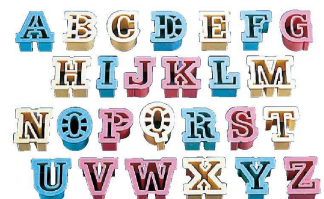
11 PS クッキー抜型アルファベット No.1733 (26ヶ入) <WKT-L1> 9-1121-1101 ¥1,800 セット内容:アルファベット26文字 材質:スチロール樹脂 耐熱温度:80℃