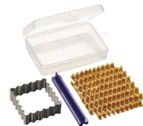
7 ミニミニクッキースタンプ I No.1744 (アルファベット) <WKT-X0> 9-1121-0701 ¥950 200×125×H40 材質:スタンプ台、文字パーツ/ABS樹脂 抜型/18-8ステンレス ケース/ポリプロピレン セット内容:スタンプ台、クッキー抜型、 アルファベット55個、数字18個、 記号20個、収納ケース