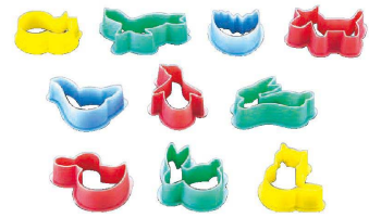
9 PS クッキー動物抜型 No.752 (10ヶ入) <WKT-09> 9-1121-0901 ¥550 ヒヨコ、オットセイ、タマコ、イヌ、トビ、ペンギン、 ウサギ、アヒル、ニワトリ、タヌキ 材質:スチロール樹脂 耐熱温度:80℃