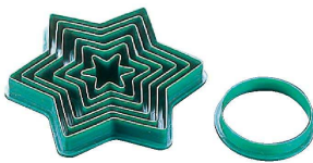
13 ミルフィーユキット もみの木 C-011 <WML-20> 9-1121-1301 ¥850 丸型 1ヶφ70 星型 6ヶ 最大150×150 最小40×40 材質:ポリプロピレン 耐熱温度:100℃ ●冷凍バイ生地を使って、簡単に作れます。