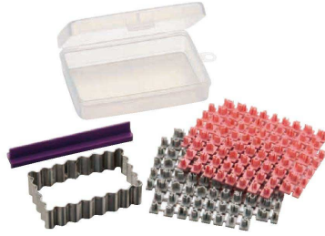
8 ミニミニクッキースタンプ II No.1749 (ひらがな) <WKT-X1> 9-1121-0801 ¥1,200 200×135×H49 材質:スタンプ台、文字パーツ/ABS樹脂 抜型/18-8ステンレス ケース/ポリプロピレン セット内容:スタンプ台、クッキー抜型、ひらがな 46個、濁点18個、小文字10個、 収納ケース