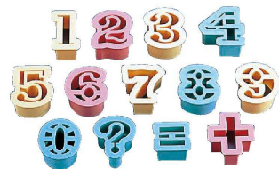
10 PS クッキー抜型フィガ (数字) No.1734 (13ヶ入) <WKT-LO> 9-1121-1001 ¥950 セット内容:0-9 ? = + 材質:スチロール樹脂 耐熱温度:80℃