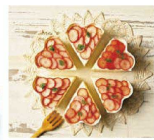
ファンシーデコレ花形は6等分するとハート型に!