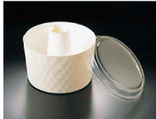
① 蓋付 シフォンカップ 白無地 SC-840-A (50枚入) 入販 〈WSH-14〉 9-1135-0101 ¥16,900 本 体:内φ150×H100 ベツ蓋:内φ168×H 22