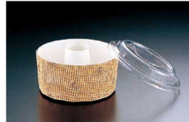
③ スモール蓋付 シフォン ロイヤルクレスト柄 SC-836-A (50枚入) 入販 〈WSH-19〉 9-1135-0301 ¥10,500 本 体:内φ120×H60 ベツ蓋:内φ130×H21

おいしさをさらに個性的に演出するベーキングモルド 旬のフルーツなどを使って、オリジナルのバウンドケーキやタルトを焼いてください。焼き型が要らずそのままオープンに入れることができます。