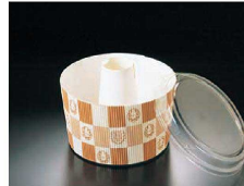
② 蓋付 シフォンカップ 白・エンブレム格子柄 SC-841-A (50枚入) 入販 〈WSH-15〉 9-1135-0201 ¥18,100 本 体:内φ150×H100 ベツ蓋:内φ168×H 22