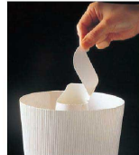
焼き上がり後、筒のトップをマシン目にして切り離して下さい。