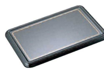
⑩ 陶器風メラミン製 ケーキトレー 角型

9-1142-0902 CT-2634-WS ¥6,400 340(290)×260(220)×H15 耐熱120℃