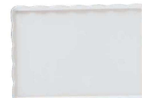
⑲ ウェーブメラミンケーキトレー(白) (WKC-O0) 目

9-1142-1803 YO-2035-G ¥2,000 350(325)×200(175)×H15