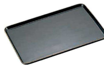
⑥ 陶器製 ケーキトレー 角型(金線入) (WKC-H7) 目

9-1142-0601 EM-16-KS ¥8,400 345×233×H10 9-1142-0602 EM-17-KS ¥5,200 310×170×H10