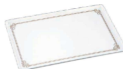
⑭ 陶器風メラミントレー (金唐草線入) (WTL-A6) 目

⑬⑭ 有効内寸:YO-300 380×280 YO-250 330×235 YO-160 330×140