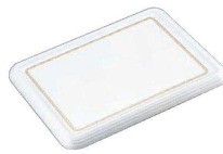
⑨ 陶器風メラミン製 ケーキトレー 角型

〈WKC-H5〉目 9-1142-0801 ¥5,200 φ255(235)×H10