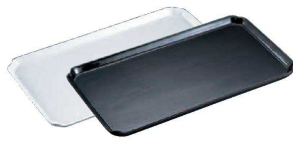
② 陶磁器 ケーキプレート 角 淵無 (WKC-N3)

9-1142-0201 白 ¥4,700 9-1142-0202 黒 ¥3,400 311(290)×170(150)×H15 耐熱温度:450℃ ●足4ヶ所付(スベリ止め) ●欠けやすい4隅のコーナー部の角を あらかじめ取ったデザインです。