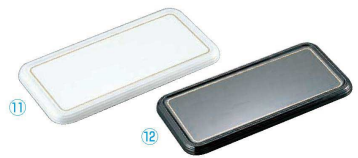
陶器風メラミン製 ケーキトレー 長角型

9-1142-1002 CT-2634-KS ¥6,400 340(290)×260(220)×H15 耐熱120℃