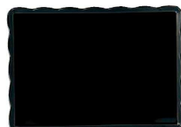
⑰ ウェーブメラミンケーキトレー(黒) (WKC-N7) 目

9-1142-1602 CT-2300-KS ¥3,500 φ230(195)×H15 耐熱120℃