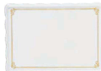
⑱ ウェーブメラミンケーキトレー(金唐草) (WKC-N8) 目

9-1142-1703 YO-2035-K ¥1,640 350(325)×200(175)×H15