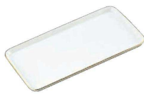
⑤ 陶器製 ケーキトレー 角型(金線入) (WKC-H6) 目

〈WKC-N0〉 9-1142-0401 ¥3,500 φ260(240)×H17 耐熱温度:450℃ ●足付(スベリ止め) ●プラチナライン入り