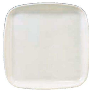
⑧ ニューウェーブ セルフトレー SY-888V 〈WTL-F4〉 9-1154-0801 ¥2,040 340×340×H40 材質:FRP(耐熱130℃)