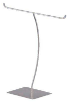
① TKG 18-8 ワインド トングスタンド 〈BTV-K6〉 9-1154-0101 ¥4,900 340×H350 ベースサイズ:150×120 トング数目安:約10本