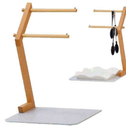
⑦ クサラ セルフスタンド 全品直送 〈WSL-A6〉 9-1154-0701 R BSS-L01 9-1154-0702 L BSS-L02 420×360×H575 材質:木部/ビーチ材・ラミン材 (ウレタン塗装) ベース/人造大理石 ※写真のトレー・トングは別売です。