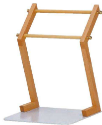
⑥ クサラ セルフスタンド W BSS-W01 全品直送 〈WSL-A5〉 9-1154-0601 ¥25,800 420×360×H575 材質:木部/ビーチ材・ラミン材 (ウレタン塗装) ベース/人造大理石