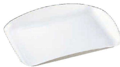
⑨ ニューウェーブ セルフ・セルストレー SY-777 〈WTL-A9〉 9-1154-0901 ¥2,440 398×299×H40(20) 材質:FRP(耐熱130℃)