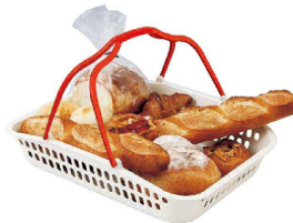
⑫ セルフバスケット 中深型 YK-1000-V 〈WSL-86〉 全品直送 ¥1,600 9-1154-1201 レッド 9-1154-1202 ブルー 9-1154-1203 オレンジ 9-1154-1204 グリーン 9-1154-1205 イエロー 440×330×深さ70