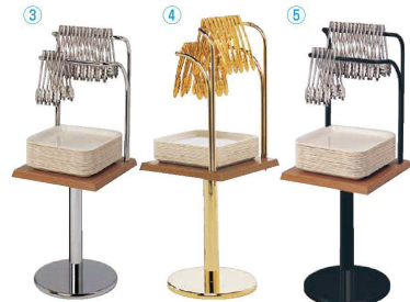
③ シンプル セルフスタンド P-67-S 全品直送 全国送料別添 1~2日 〈PSL-90〉 9-1154-0301 ¥71,000 400×400×H1,050

①② ●大量のトングに対応出来る ワイドタイプのトングスタンドです。 ●高めの設計で、パネなしタイプの トングにもご使用いただけます。 ※ベースをバット類の下にセットして ご使用ください。