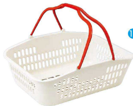
⑪ セルフバスケット 深型 YK-1500-V 〈WSL-87〉 全品直送 ¥1,900 9-1154-1101 レッド 9-1154-1102 ブルー 9-1154-1103 オレンジ 9-1154-1104 グリーン 9-1154-1105 イエロー 440×330×深さ120