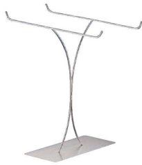
② TKG 18-8 ワインド ベーカー セルフスタンド(ダブルタイプ) 〈BTV-K7〉 9-1154-0201 ¥9,800 439×200×H445 ベースサイズ:310×140 トング数目安:約20本