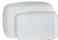
⑩ ニューウェーブトレー 〈WTL-C5〉 材質:FRP 9-1154-1001 SY-555(中) 350×250×H40 260g ¥1,950 内300×195 9-1154-1002 SY-333(小) 300×200×H35 165g ¥1,640 内250×140