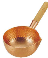
⑥ 銅 ポーズ鍋 (WBC-24)