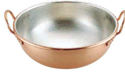
② SA銅打出さわり鍋 手付・スズメッキ付き (WSW-02)