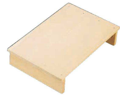
⑱ 白木 洋取板 (WTL-48) 9-1157-1801 ¥11,000 580×360×H118