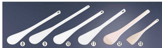
⑧ デバイヤー スパチュラ (ポリガラス製) (WSP-52)

〔WTL-E8〕 9-1157-0701 ¥5,000 435×405×H135 容量10ℓ 質量1.3kg ●取手付きで、持ち運びにも便利です。