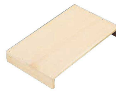
⑰ 白木 和取板 (WTL-47) 9-1157-1701 ¥10,000 580×360×H73

外寸:596×400×H127 有効高さ:123 材質:FRPP (ガラス繊維強化ポリプロピレン) ●ケーキ・カステラ用作業台に最適です。