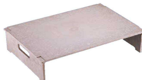
⑯ 取板 1型 FRPP (耐熱用) (WTL-B4) 9-1157-1601 ¥15,740

外寸:596×400×H127 有効高さ:123 材質:FRPP (ガラス繊維強化ポリプロピレン) ●ケーキ・カステラ用作業台に最適です。