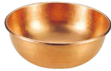
① Ω銅 打出 さわり鍋 手無・スズメッキなし (WSW-01)