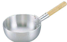
⑤ アルミ DON 打出 片手ポーズ鍋 (WBC-38)