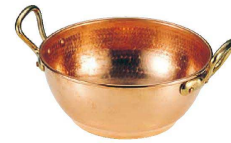
③ モービル 銅 シロップボール (スズメッキなし) (WBC-21)