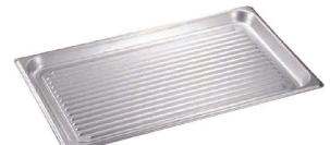
⑧ 18-8 波型ホテルパン 1/1 94011