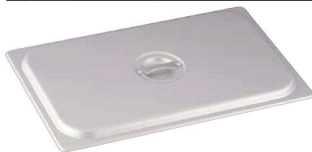
⑤ マイスター アルミホテルパンカバー (硫酸アルマイト加工・膜厚6ミクロン) <AHT-98>

③④ ●フッ素樹脂加工でこびりつきにくく、洗浄も簡単です。 ※金属タワシ、金属ヘラはご使用しないでください。 ※深さ25・40mmは底面のみ、65mmは底面と側面に穴が明いています。