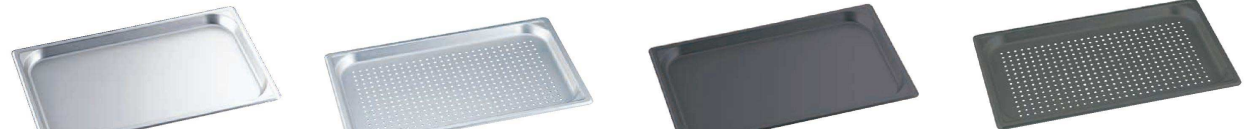
① マイスター アルミ ホテルパン (硫酸アルマイト加工・膜厚6ミクロン) <AHT-87>