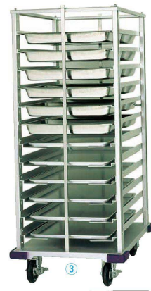
※カート直送 運賃別途 納約3週間