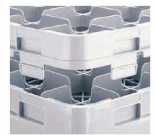
組み立てると外れにくいはめ込み構造。