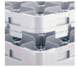
組み立てると外れにくいはめ込み構造。