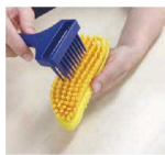
⑪ メンテナンスブラシ (残渣取りブラシ) 11231 (JMV-02) 9-1291-1101 ¥1,450 150×70×H55 クシの長さ:40mm 材質:ポリプロピレン ●長いクシがブラシに付属した残渣やホコリをしっかり掻き取ります。