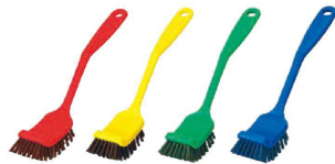
⑩ HPM ディッシュ 磁性ブラシ ワイド (JZS-04) ¥4,500 9-1291-1001 レッド 57022 9-1291-1002 イエロー 57023 9-1291-1003 グリーン 57024 9-1291-1004 ブルー 57025 45×40×全長290 毛長:20