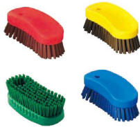
⑤ HPM ニューハンド 磁性ブラシ S (JZS-01) ¥4,500 9-1291-0501 レッド 57032 9-1291-0502 イエロー 57033 9-1291-0503 グリーン 57034 9-1291-0504 ブルー 57035 45×120 毛長:25