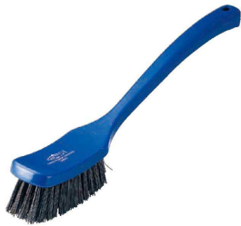
① ロングハンドルブラシ D9-RMDX (JYN-39) 9-1291-0101 ¥9,700 65×120×全長406 毛長:40