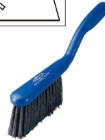
③ ベーカーリーブラシ B861-RMDX (JYN-37) 9-1291-0301 ¥7,300 25×150×全長317 毛長:57 材質:本体/ポリプロピレン 毛/ミディアムポリエステル毛