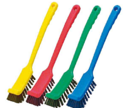
⑧ HPM ロングハンドル 磁性ブラシ (JZS-06) ¥6,100 9-1291-0801 レッド 57002 9-1291-0802 イエロー 57003 9-1291-0803 グリーン 57004 9-1291-0804 ブルー 57005 45×70×全長435 毛長:40