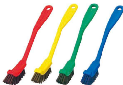
⑨ HPM ディッシュ 磁性ブラシ スリム (JZS-03) ¥4,100 9-1291-0901 レッド 57012 9-1291-0902 イエロー 57013 9-1291-0903 グリーン 57014 9-1291-0904 ブルー 57015 22×45×全長290 毛長:25