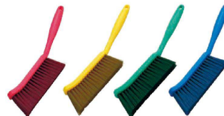
⑦ HPM ベーカーリー 磁性ブラシ (JZS-05) ¥5,400 9-1291-0701 レッド 57052 9-1291-0702 イエロー 57053 9-1291-0703 グリーン 57054 9-1291-0704 ブルー 57055 35×110×全長350 毛長:50