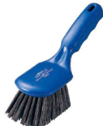
② ショートハンドルブラシ D4-RMDX (JYN-38) 9-1291-0201 ¥8,350 80×100×全長254 材質:本体/ポリプロピレン 毛/ハードポリエステル毛