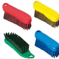
⑥ HPM ハンド 磁性ブラシ L (JZS-02) ¥4,700 9-1291-0601 レッド 57042 9-1291-0602 イエロー 57043 9-1291-0603 グリーン 57044 9-1291-0604 ブルー 57045 50×190 毛長:30