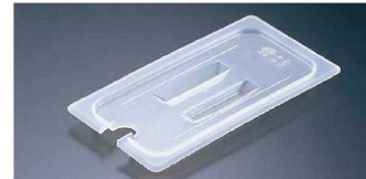
③ 半透明フードパン用 切込・取手付カバー (AHC-54)