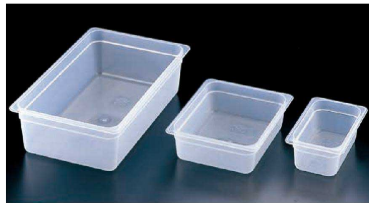
① 半透明フードパン (AHC-51)