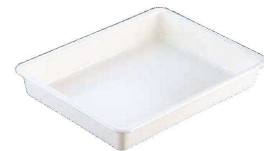
⑮ PPカラーバット (ABT-F1) (抗菌)