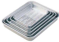
⑨ アルマイト 穴明バット (ABT-25) U