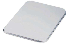
③ アルマイト 大型バット蓋 (ABT-87) U