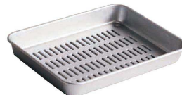
⑥ ホクア アルマイト穴明バット (ABT-J5)