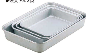
④ アルマイト 深バット (ABT-28) U