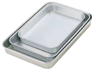
① アルマイト 大型バット (ABT-22) U