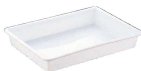
⑭ サンコー サンバット (抗菌) (ポリプロピレン) (ASV-76) U