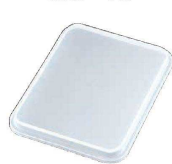
⑬ アルマイト 標準バットフタ (ABT-J1) U