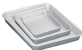
⑤ ホクア アルマイト標準バット (ABT-J3)