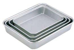
⑦ アルマイト 標準バット深型 (ABT-67) U