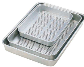
② アルマイト 穴明大型バット (ABT-23) U