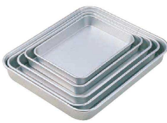
⑧ アルマイト 標準バット (ABT-24) U