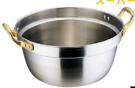
① Ωスーパーデンジ 円付鍋 (ADV-03)