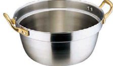
⑦ エコクリーン Ωスーパーデンジ 円付鍋 (内面ゼロクリア2コート加工) (AEK-04) 目