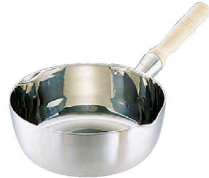
② Ωスーパーデンジ 雪平鍋 (クラッド鋼) (AYK-46)