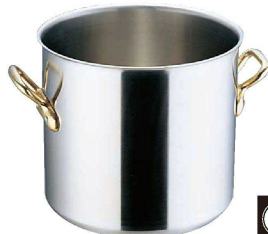
④ エコクリーン Ωスーパーデンジ 18cm 寸胴鍋 (蓋無) (内面ゼロクリア2コート加工) (AEK-01) 目