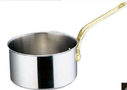
⑥ エコクリーン Ωスーパーデンジ 18cm シチューパン (蓋無) (内面ゼロクリア2コート加工) (AEK-03) 目