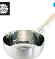
⑧ エコクリーン Ωスーパーデンジ 雪平鍋 (クラッド鋼) (内面ゼロクリア2コート加工) (AEK-05) 目