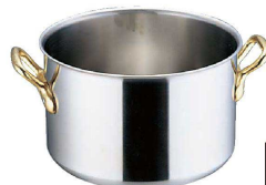
⑤ エコクリーン Ωスーパーデンジ 18cm 半寸胴鍋 (蓋無) (内面ゼロクリア2コート加工) (AEK-02) 目