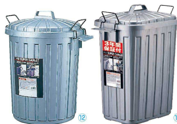
12 スーパーカン丸型 L-112C 〈KSC-03〉目 9-1402-1201 ¥4,200 φ430×H560 45ℓ