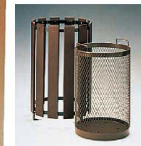
10 木調くずいれYD-66C-IY 〈KKZ-12〉目 9-1402-1001 ¥30,700 φ400×H635 材質:本体 天然木 枠・中カゴ スチールメラミン焼付