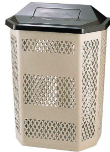
3 サンクリーンボックス A-3(回転蓋) 〈KKL-07〉目 9-1402-0301 ¥26,200 662×462×H898 材質:本体 ポリエチレン 蓋 ポリプロピレン