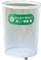
5 くずいれ パーク80 丸型 〈KKZ-08〉目 9-1402-0501 ¥9,400 φ470×H635 エキスパンダメタルP.Eコーティング