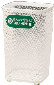
9 くずいれ パーク80 マルエス角型 〈KKZ-10〉目 9-1402-0901 ¥11,000 460×460×H680 エキスパンダメタルP.Eコーティング