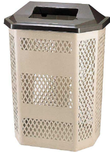
2 サンクリーンボックス A-2(中蓋無) 〈KKL-06〉目 9-1402-0201 ¥26,200 662×462×H898 材質:本体 ポリエチレン 蓋 ポリプロピレン