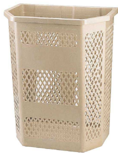
1 サンクリーンボックス A-1(本体のみ) 〈KKL-05〉目 9-1402-0101 ¥22,000 662×462×H770 材質:ポリエチレン