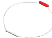
8 くずいれパーク80 丸型用袋止め金具 〈KKZ-11〉目 9-1402-0801 ¥1,500 φ430 材質:ステンレス ●ポリ袋が、ゴミの重さによってずり落ちたりしません。 ※⑤パーク80丸形にご使用できます。