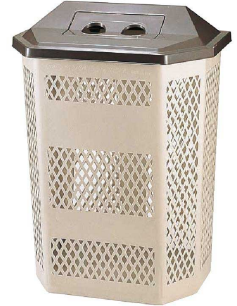
4 サンクリーンボックス A-4(空缶蓋) 〈KKL-08〉目 9-1402-0401 ¥26,200 662×462×H898 材質:本体 ポリエチレン 蓋 ポリプロピレン