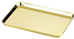
② 18-0金仕上げ ディスプレイトレイ〈ADI-14〉