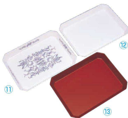
メラミン ユニバット ⑪ F-10 フロアリー

〔ABT-88〕 9-0141-1101 ¥4,090 338×248×H43 底面285×200