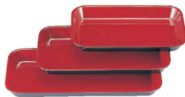
⑱ メラミン(小)デリカバット 黒内朱 (ADL-J5)