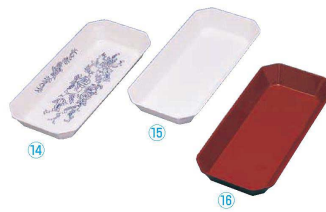
メラミン ユニバット ⑭ F-11 フロアリー

●お惣菜のディスプレイに ※⑪~⑬網はP.136⑩アルマイト大型バット用網中のサイズが合います。(別売)