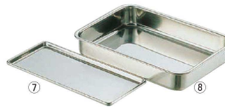
⑦ 18-8 ネットケーストレイ (BNT-01) 9-0141-0701 ¥1,000 200×90