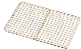
④ 18-8金仕上げ ディスプレイトレイ用クリンプ目アミ〈ADI-20〉