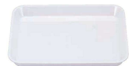
⑲ メラミン(大)デリカバット 白 (ADL-J4)