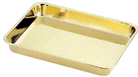
① 18-8金仕上げ ディスプレイバット〈ADI-12〉