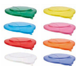
⑬ ヴァイカン ハイジーンバケツ 5686 (KBK-36) 目 ￥6,150