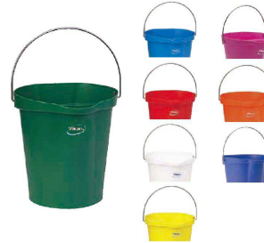
⑩ ポリカバケツ PO-15A (KBK-28) 9-1422-1001 ￥5,860