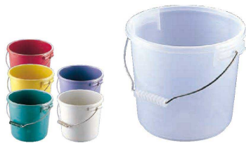
⑦ ポリプロバケツ PO-13A (KBK-26) ￥3,660