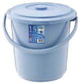
① ベルク バケツ ブルー (KBK-46) 目