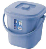
② ベルク 角バケツ ブルー (KBK-47) 目