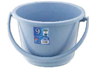
③ ベルク 広口バケツ ブルー (KBK-48) 目