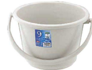
⑥ ベルク 広口バケツ グレー (KBK-51) 目