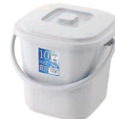
⑤ ベルク 角バケツ グレー (KBK-50) 目