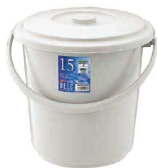
④ ベルク バケツ グレー (KBK-49) 目