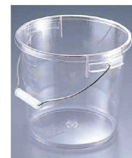
⑩ ポリカバケツ PO-15A (KBK-28) 9-1422-1001 ￥5,860

φ290×H265 容量:約13L 材質:本体/ポリカーボネイト つり手/18-8ステンレス