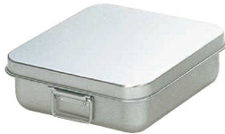
⑫ アルマイト 天ぷら入 (蓋付) (ATV-19) 回