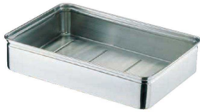
① 18-8 番重バット (ABV-11)