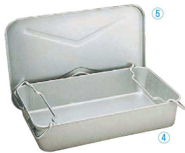
④ アルマイト 漁缶 280-A

(AGY-35) 回 9-0148-0401 ￥16,000 610×387×H125