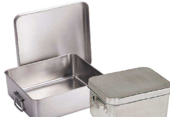
⑭ 18-8 天ぷら入 (蓋付) (ATV-33) 回