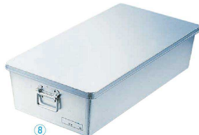
⑧ アルマイト 給食用 パン箱浅型 (蓋付) 260 (60個入)

9-0148-0702 259 本体:535×385×H250 ￥58,800 (60個入) 蓋:555×405×H 21