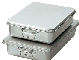
⑬ アルマイト 天ぷら入 (蓋付) (ATV-17) 回