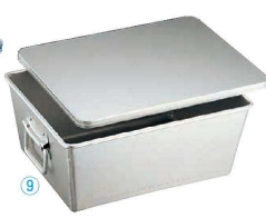
⑨ アルマイト 溶接 給食用パン箱 (蓋付) 260-B (20個入)