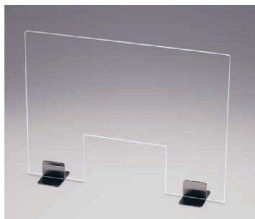
スタンド：ステンレス仕様