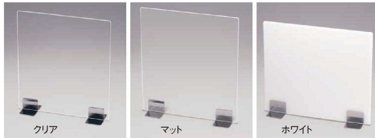
スタンド：ステンレス仕様