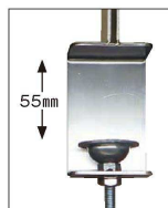
クランプを締め付ける事で最大55mm厚のテーブルまで対応

※クランプ式縦型・横型は1個単位での出荷になります。 ※飛沫ガードパーテーション400・600・窓付きシリーズに付け替えてご使用できます。