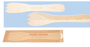
⑦ 先割スプーン 15T-F 紙袋入 (100本入) 〈XKM-18〉 9-1572-2101 ¥1,750 全長:150 ※1本袋入