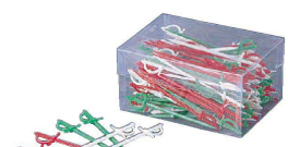
⑭ サーベルピック (150本入) 〈QPT-23〉 9-1572-1401 ¥980 全長:78 材質:プラスチック製 ●色込み