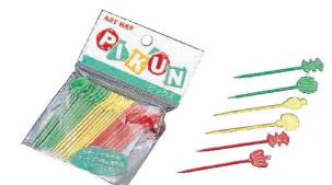
⑱ カラーピックス AL-92 (30本入) 〈QPT-21〉 9-1572-1901 ¥150 全長:約65 材質:ポリスチレン (耐熱70℃) ●色込み