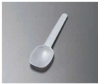
① バイオマススプーン 小 (1,000本入) 単袋入 〈XBI-12〉 9-1572-0101 ¥5,700 全長:80