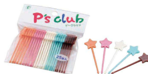
⑰ ランチピックス Y-102 (25本袋入) 〈QPT-18〉 9-1572-1801 ¥210 全長:60 材質:ポリスチレン (耐熱70℃) ●色込み