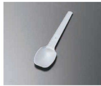
② バイオマスプラススプーン 中 B #100 (500本入) 単袋入 〈XBI-14〉 9-1572-0201 ¥3,500 全長:100