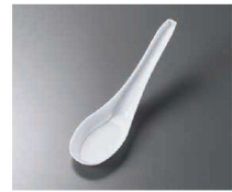
④ バイオマスチリレンゲ 白 (100本入) 単袋入 〈XBI-11〉 9-1572-0401 ¥1,400 全長:143