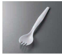
③ バイオマスフォークスプーン #140 (100本入) 単袋入 〈XBI-10〉 9-1572-0301 ¥1,200 全長:140