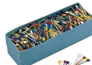
⑬ 業務用 動物ピック 〈XPT-06〉 9-1572-1301 ¥8,500 約2,000本入 全長:約65