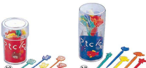
⑯ チビッコピックス (25本入) 〈QPT-25〉 9-1572-1601 ¥240 全長:65 材質:ポリスチレン ●色込み