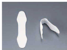
⑩ おるかみトング (1,000本入) 〈XKM-17〉 9-1572-1001 ¥4,600 全長:100 最大幅:20.5 ●お菓子やフライドポテトなど指を汚さずにつまめます。 ●トングを置いた際に下に先がつかないので衛生的です。