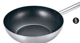
⑤ トリノ 中華鍋(内面フッ素樹脂加工) (ATY-D3)