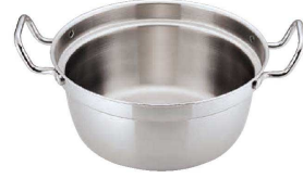
③ トリノ 和鍋 (AWN-02)