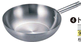
④ トリノ 中華鍋 (ATY-D2)