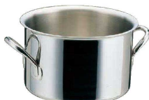
⑧ エオリア 半寸銅鍋 (AHV-48)