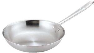
① トリノ フライパン (AHL-T9)