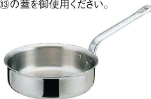
⑪ エオリア 片手浅型銅鍋 (AST-63)