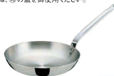
⑫ エオリア フライパン (AHL-95)