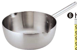
⑥ トリノ 雪平鍋 (AYK-65)