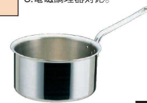
⑩ エオリア 片手深型銅鍋 (AST-62)