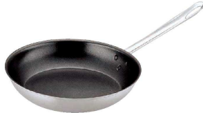
② トリノ フライパン(内面フッ素加工) (AHL-U0)