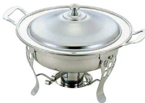
⑤ UK 18-8 共柄 丸チェーフィングデッシュ (NTE-27) インチ 9-1631-0501 13 1/2 440×340×H290 ¥56,000 9-1631-0502 18 550×450×H350 ¥100,000