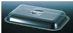
⑪ UK ポリカーボネイト製 角チェーフィング用カバー (NTE-B1) インチ用 9-1631-1101 16 390×255×H55 ¥13,500 9-1631-1102 20 485×305×H60 ¥18,500 9-1631-1103 22 540×335×H65 ¥19,800 9-1631-1104 26 630×375×H70 ¥24,700