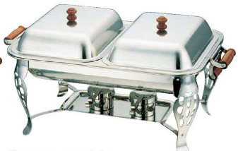
⑧ UK 18-8 木柄 角チェーフィングデッシュ ダブル (NTE-30) インチ 9-1631-0801 16 510×270×H260 ¥63,000 9-1631-0802 20 610×325×H305 ¥96,000 9-1631-0803 22 660×360×H315 ¥107,000