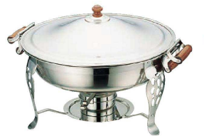
⑩ UK 18-8 木柄 丸チェーフィングデッシュ (両手) (NTE-32) インチ 9-1631-1001 13 1/2 355×340×H290 ¥54,000 9-1631-1002 18 550×450×H350 ¥100,000