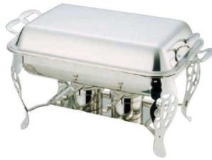
② UK 18-8 共柄 角チェーフィングデッシュ シングル (NTE-24) インチ 9-1631-0201 20 610×325×H305 ¥105,000 9-1631-0202 22 660×360×H315 ¥108,000 9-1631-0203 26 786×405×H355 ¥157,000