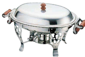
⑨ UK 18-8 木柄 小判チェーフィングデッシュ (NTE-31) インチ 9-1631-0901 15 1/2 485×280×H275 ¥61,000 9-1631-0902 20 610×370×H325 ¥96,000