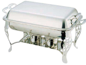
② UK 18-8 共柄 角チェーフィングデッシュ シングル (NTE-24) インチ 9-1631-0201 20 610×325×H305 ¥105,000 9-1631-0202 22 660×360×H315 ¥108,000 9-1631-0203 26 786×405×H355 ¥157,000