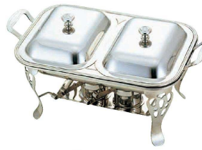
③ UK 18-8 共柄 角チェーフィングデッシュ ダブル (NTE-25) インチ 9-1631-0301 16 510×270×H260 ¥62,000 9-1631-0302 20 610×325×H305 ¥105,000 9-1631-0303 22 660×360×H315 ¥108,000 9-1631-0304 26 786×405×H355 ¥157,000