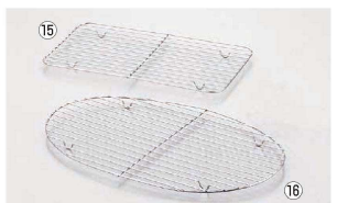
UK 18-8 チェーフィング用アミ (NTE-40) ⑮ 角チェーフィング用 インチ用 9-1631-1501 16 325×185 ¥3,300 9-1631-1502 20 415×224 ¥4,100 9-1631-1503 22 455×245 ¥4,300