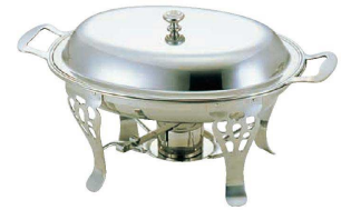
④ UK 18-8 共柄 小判チェーフィングデッシュ (NTE-26) インチ 9-1631-0401 15 1/2 485×280×H275 ¥61,000 9-1631-0402 20 610×370×H325 ¥98,000