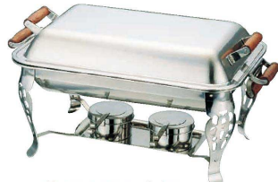
⑦ UK 18-8 木柄 角チェーフィングデッシュ シングル 22インチ (NTE-29) 9-1631-0701 ¥107,000 660×360×H315