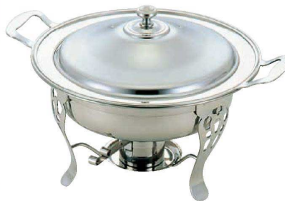
⑤ UK 18-8 共柄 丸チェーフィングデッシュ (NTE-27) インチ 9-1631-0501 13 1/2 440×340×H290 ¥56,000 9-1631-0502 18 550×450×H350 ¥100,000