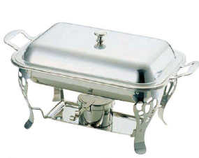
① UK 18-8 共柄 角チェーフィングデッシュ シングル 16インチ (NTE-23) 9-1631-0101 ¥63,000 510×270×H260