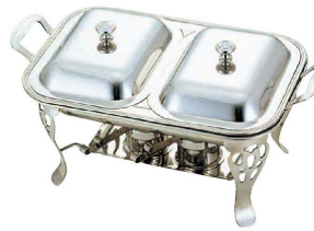
③ UK 18-8 共柄 角チェーフィングデッシュ ダブル (NTE-25) インチ 9-1631-0301 16 510×270×H260 ¥62,000 9-1631-0302 20 610×325×H305 ¥105,000 9-1631-0303 22 660×360×H315 ¥108,000 9-1631-0304 26 786×405×H355 ¥157,000