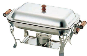
⑥ UK 18-8 木柄 角チェーフィングデッシュ シングル (NTE-28) インチ 9-1631-0601 16 510×270×H260 ¥63,000 (ランプ1個付) 9-1631-0602 20 610×325×H305 ¥96,000 (ランプ2個付)