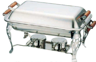
⑦ UK 18-8 木柄 角チェーフィングデッシュ シングル 22インチ (NTE-29) 9-1631-0701 ¥107,000 660×360×H315