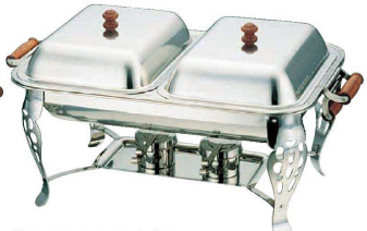
⑧ UK 18-8 木柄 角チェーフィングデッシュ ダブル (NTE-30) インチ 9-1631-0801 16 510×270×H260 ¥63,000 9-1631-0802 20 610×325×H305 ¥96,000 9-1631-0803 22 660×360×H315 ¥107,000