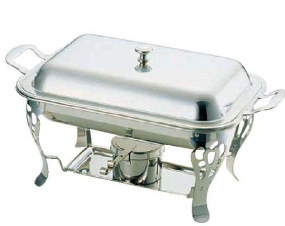
① UK 18-8 共柄 角チェーフィングデッシュ シングル 16インチ (NTE-23) 9-1631-0101 ¥63,000 510×270×H260