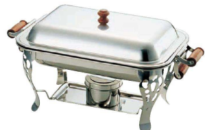
⑥ UK 18-8 木柄 角チェーフィングデッシュ シングル (NTE-28) インチ 9-1631-0601 16 510×270×H260 ¥63,000 (ランプ1個付) 9-1631-0602 20 610×325×H305 ¥96,000 (ランプ2個付)