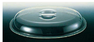
⑫ UK ポリカーボネイト製 小判チェーフィング用カバー (NTE-B3) インチ用 9-1631-1201 15 1/2 365×255×H55 ¥13,500 9-1631-1202 18 430×305×H60 ¥15,200 9-1631-1203 20 485×350×H60 ¥19,000 9-1631-1204 24 590×360×H65 ¥25,000