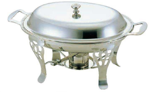
④ UK 18-8 共柄 小判チェーフィングデッシュ (NTE-26) インチ 9-1631-0401 15 1/2 485×280×H275 ¥61,000 9-1631-0402 20 610×370×H325 ¥98,000