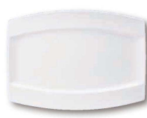
⑰ 50763-5532 31cmプラター 〈RAL-27〉 9-1666-1701 ¥6,300 310×224×H16