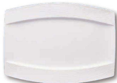
⑯ 50763-5342 38cmプラター 〈RAL-26〉 9-1666-1601 ¥8,100 382×280×H18