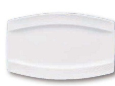
⑱ 50763-9733 23cmオブロングトレイ 〈RAL-28〉 9-1666-1801 ¥2,800 237×141×H13