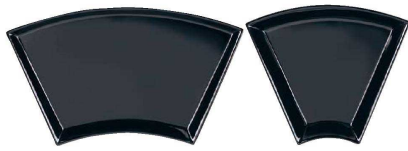
3 ラック B-コンセプト ビュッフェディッシュ ブラック (NMY-09) 9-1668-0301 大 510×300×H35 ¥18,000 9-1668-0302 小 300×260×H43 ¥12,000