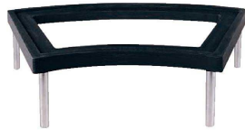
2 ラック B-コンセプト ウッズスタンド 大 (NMY-10) 9-1668-0201 ¥70,000 510×300×H50・100・140(3段階) ①② 材質：脚部/ステンレス ●高さや向きを変えて組み合わせることで、様々な演出ができます。