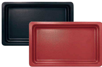
5 ラック ガストロノームパン 角型 1/1 (NMY-04) ¥22,000 9-1668-0501 ブラック RA1108GNSE 9-1668-0502 レッド RA1108GNDR 530×325×H65 7.3ℓ

⑤～⑧材質：磁器 ※直火ではご使用になれません。 耐熱温度：300℃ ●オープンはもちろん、電子レンジ、食器洗浄機にも対応しています。