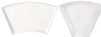
4 ラック B-コンセプト ビュッフェディッシュ ホワイト (NMY-08) 9-1668-0401 大 510×300×H35 ¥12,000 9-1668-0402 小 300×260×H43 ¥8,000