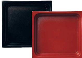
6 ラック ガストロノームパン 角型 2/3 (NMY-07) ¥12,000 9-1668-0601 ブラック RA2308GNSE 9-1668-0602 レッド RA2308GNDR 354×325×H65 4.7ℓ