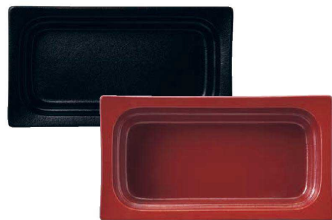
8 ラック ガストロノームパン 角型 1/3 (NMY-06) ¥7,000 9-1668-0801 ブラック RA1308GNSE 9-1668-0802 レッド RA1308GNDR 325×176×H65 2.0ℓ

KINGOチェーフィング・TKG和風ビュッフェにもセットしてご使用いただけます。