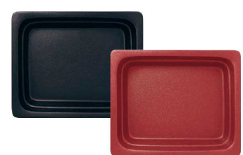
7 ラック ガストロノームパン 角型 1/2 (NMY-05) ¥10,000 9-1668-0701 ブラック RA1208GNSE 9-1668-0702 レッド RA1208GNDR 325×265×H65 3.3ℓ