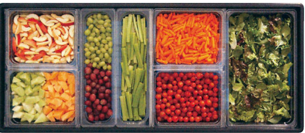
フードバーセットアップ例