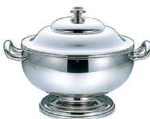
④ UK18-8 バロン 丸スープチューリン 〈NSC-23〉 9-1747-0401 L φ240×H230 3,000c.c. ¥63,200 9-1747-0402 M φ200×H190 1,500c.c. ¥56,400 9-1747-0403 S φ160×H150 800c.c. ¥47,000