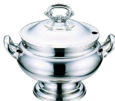
② UK18-8 B淵 丸スープチューリン 〈NSC-20〉 9-1747-0201 ¥54,000 φ260×H220 3,000c.c.