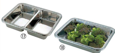
UK18-8 エスコフェデッシュ ①⑦ ダブル 〈NES-21〉 9-1747-1701 ¥21,700 330×270×H60