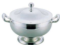
③ UK18-8 ロイヤル 丸スープチューリン 〈NSC-22〉 9-1747-0301 M φ200×H190 1,500c.c. ¥55,000 9-1747-0302 S φ160×H150 800c.c. ¥46,000