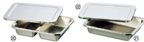
②⑩ SW18-8 エスカフェア仕切付 〈NES-24〉 9-1747-2001 ¥11,700 328×265×H65