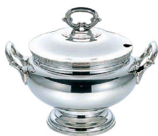
① UK18-8 菊淵 丸スープチューリン 〈NSC-18〉 9-1747-0101 ¥58,500 φ275×H230 3,000c.c.