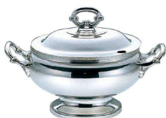
⑥ UK18-8 菊淵 小判スープチューリン 〈NSC-19〉 9-1747-0601 L 310×200×H230 3,300c.c. ¥65,700 9-1747-0602 S 290×185×H210 2,500c.c. ¥61,000