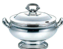
⑦ UK18-8 B淵 小判スープチューリン 〈NSC-21〉 9-1747-0701 L 300×200×H230 3,300c.c. ¥63,000 9-1747-0702 S 280×185×H210 2,500c.c. ¥58,000