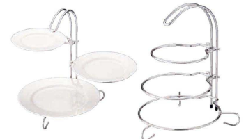
⑪ アフタヌーンティースタンド (クロムメッキ)

材質:18-8ステンレス 対応プレートサイズ:φ240~300mm ●折りたたんでコンパクトに収納できます。 ●プレートが安定するシリコンの滑り止め付きです。