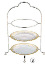
⑥ UK 18-8 3段 ハイティースタンド

皿受:φ148, φ168, φ200 対応プレートサイズ:上段 約165~175 中段 約180~195 下段 約210~220 ※写真のプレートは別売です。