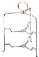
⑬ 21cmプレート用ハイティースタンド 9/HAK