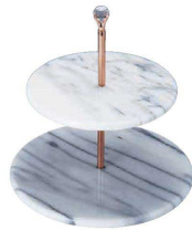
② 大理石製 2段デザートプレート TP0005-01A ラウンド