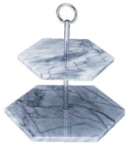
① 大理石製 2段デザートプレート TP0006-01A 6角