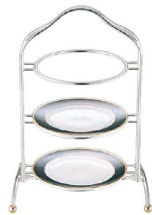
⑤ UK アフタヌーン ティースタンド 3サイズ用 (銀メッキ)

皿受:φ160 対応プレートサイズ:約180~200 ※写真のプレートは別売です。