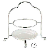
⑦ UK 18-8 2段 ハイティースタンド