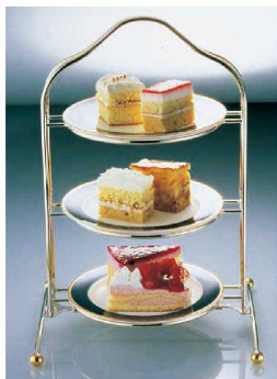
④ UK アフタヌーン ティースタンド 1サイズ用 (銀メッキ)

295×250×H380 折り畳みサイズ:190×40×H380 材質:18-8ステンレス 対応プレートサイズ:φ250~290mm ●折りたたんでコンパクトに収納できます。