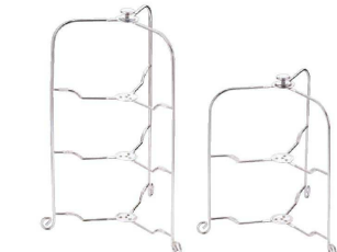
⑩ ワンタッチプレートスタンド