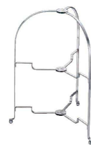
③ 18-8 ワンタッチ ハイティースタンド 大