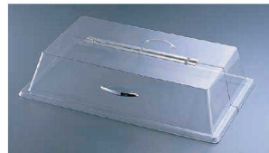
⑨ ロングヒンジ 329-12 (PKB-14) 9-1758-0901 ¥50,600 535×335×H110