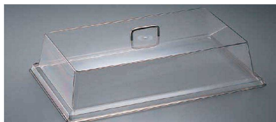
④ 角フラットカバー (PKK-32) 9-1758-0401 RD1220CW 550×355×H140 ¥18,000 9-1758-0402 RD1826CW 680×475×H150 ¥23,500