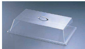
⑦ スタンダード 327-12 (PKB-12) 9-1758-0701 ¥37,500 535×335×H133