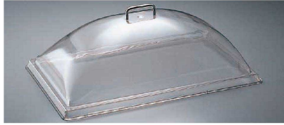
① 角ドームカバー (PKK-28) 9-1758-0101 DD1220CW 550×355×H200 ¥17,000 9-1758-0102 DD1826CW 680×480×H215 ¥24,000

気品漂よう透明感が美しさを引きだします。 ポリカーボネイト製で耐久性に優れています。