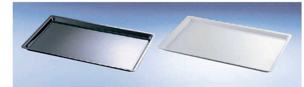
⑪ カル・ミル アクリル シャロートレー (PSY-E7) ¥39,400 9-1758-1101 325-12-13 ブラック 9-1758-1102 325-12-15 ホワイト 524×321×H22