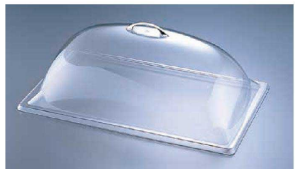
⑥ ドーム 321-12 (PKB-11) 9-1758-0601 ¥37,500 535×335×H205

●カル・ミルのポリカーボネイトカバーはガストロノーム規格の 1/1サイズにご使用できます。