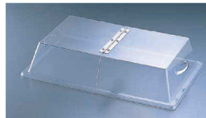
⑧ センターヒンジ 328-12 (PKB-13) 9-1758-0801 ¥50,600 535×335×H110