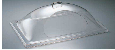
② 角ドームカバー サイドカット DD1220SCW (PKK-30) 9-1758-0201 ¥21,500 550×355×H200