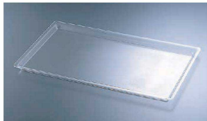
⑫ カル・ミル スリムライン シャロートレー クリアー P232-12 (PSY-E8) 9-1758-1201 ¥26,100 525×325×H21 ●アクリル製

組み合わせ自在 カル・ミル シャロートレーには、カル・ミル ポリカーボネイトカバーがセットできます。