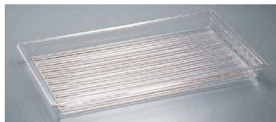
⑤ 角ディスプレイトレイ DT1220CW (PKK-34) ¥6,800 9-1758-0501 クリアー 9-1758-0502 ブラック 530×330×H40