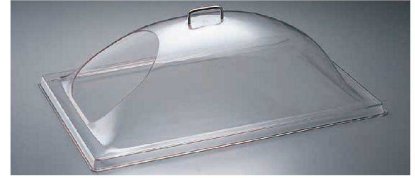
③ 角ドームカバー ワンエンドカット (PKK-29) 9-1758-0301 DD1220ECW 550×355×H200 ¥21,500 9-1758-0302 DD1826ECW 680×480×H215 ¥17,500