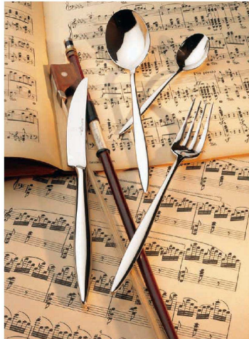
② 18-10 アダージョ (OAD-01) ㊦ オープンストック:18アイテム