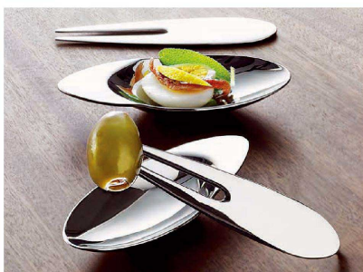
④ 18-0 アパタイズ (OAP-04) ㊦