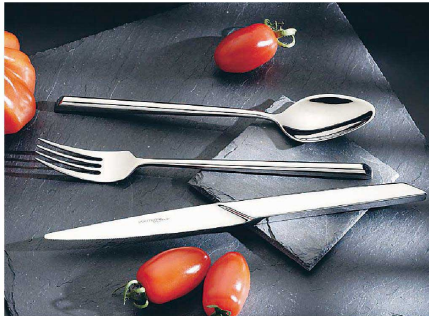
① 18-10 X-15(エックス-15) (OAT-33) ㊦ オープンストック:14アイテム