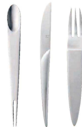
⑤ 18-8 アパタイズ (OAP-02) ㊦