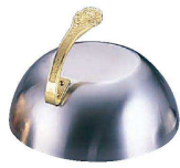
② Ω18-8丸ステーキカバー (PST-15)