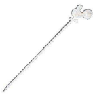
⑩ Ω18-8 風見鶏 アットレー (OAT-08)