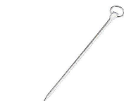
⑫ 18-0 ダイア プロセット (OPL-07)