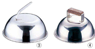
③ 18-8ステーキカバー 丸型 (PST-E6)