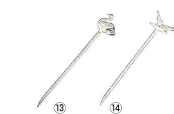
⑬ マトファ アットレー (アンチポリ製)