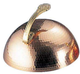
① Ω銅丸ステーキカバー (PST-16)