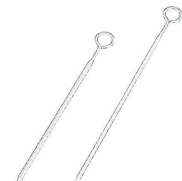
⑮ WÜSTHOF ヴォストフ 18-8 スキヤー (OSK-35)