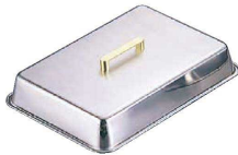
⑤ Ω18-8 真鍮柄 角ステーキカバー (GST-01)