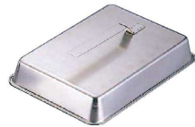
⑥ Ω18-8 ハンドル把手 角ステーキカバー (GST-09)