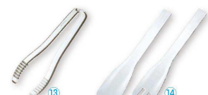
⑬ ガイオ トング (PGI-03) 9-1874-1301 ￥1,200