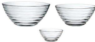
③ ビバ ボール (RBB-05)