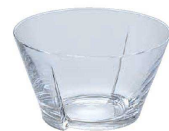
⑩ アクリル アンゲル スモールボウル KY-1018 (PBU-02) 9-1874-1001 ￥1,600