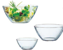
② コスモス サラダボール (ガラス製) (RKS-02)