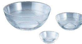
④ リス ボール (RLS-37)