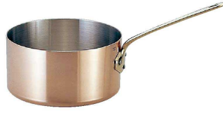
② モービル カパーイノックス 片手深型鍋 (蓋無) (AKT-77) ㊦