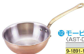
⑫ モービル カパーイノックス ソトーズ (AST-D6) ㊦