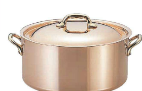
① モービル カパーイノックス 半寸銅鍋 (蓋付) (AZV-61) ㊦

●本体とハンドルはステンレスのリベットでかきしめてあるので、ゆるみも無く大変丈夫です。また内側がステンレスのサテン仕上げなので、タワシ等で強くこすっても問題なく、掃除も簡単です。