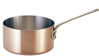
② モービル カパーイノックス 片手深型鍋 (蓋無) (AKT-77) ㊦