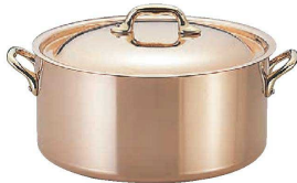
① モービル カパーイノックス 半寸銅鍋 (蓋付) (AZV-61) ㊦

●本体とハンドルはステンレスのリベットでかちめてあるので、ゆるみも無く大変丈夫です。また内側がステンレスのサテン仕上げなので、タワシ等で強くこすっても問題なく、掃除も簡単です。