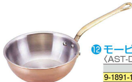
⑫ モービル カパーイノックス ソーツ (AST-D6) ㊦