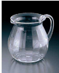
5 プロダイン アクリルピッチャー AP-23 (PPT-46) 目 9-1926-0501 ¥7,300 2.5ℓ φ148×H180