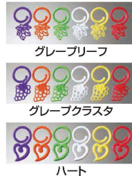
7 プロダイン シリコンステムウェアチャームセット WC-3(6色セット) 目 9-1926-0701 L グレーブリーフ 9-1926-0702 G グレーブクラスタ 9-1926-0703 H ハート 約45×25 ●ワイングラスのステムに引っかけて使用するグラスマーカーです。自分のグラスがどれかがひと目でわかります。