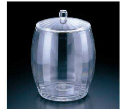
6 アクリル 二重アイスバケツ AP-98 (PAI-AA) 目 9-1926-0601 ¥10,600 3.4ℓ φ190×H265 ●内側の仲子は、取りはずし可能です。