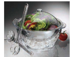
11 プロダインアイス・サラダ IC-30 (LPL-11) 目 9-1926-1101 ¥17,600 φ300×H230 材質:下ボウル/ポリスチレン サラダボウル/ステンレス(深さ105) カバー/アクリル サラダサーバー/アクリル(全長320) ●サラダサーバー付。