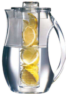
1 プロダイン アクリルフレーバーピッチャー FI-3 (PUO-C6) 目 9-1926-0101 ¥8,500 2.4ℓ 195×140×H270 ●好みのカットフルーツなどを入れるだけで、手軽にフレーバードリンクができます。