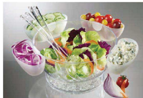
10 プロダイン アクリルオービットボウル・オンアイス AB-4 (LPL-07) 目 9-1926-1001 ¥10,900 ボウル:φ280×H150 サイドカップ:170×70×H65(ポリプロピレン) サラダサーバー:全長335(アクリル) ●スタンド部に氷を入れてサラダを保冷、新鮮さを保ちます。 ●クリップオンでボウルに取り付けできるサイドカップが4ヶ付属。ソースやトッピング入れに便利です。 ●サラダサーバー付。