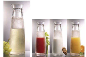
3 プロダイン アクリルアイス・カフェ IC-800 (LPL-09) 目 9-1926-0301 ¥7,400 0.8ℓ φ105×H300 ●冷凍庫で保冷液を凍らせて使用するカフェです。飲み物を薄めず冷たさをキープします。