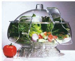
9 サラダ・オンアイス(ドームカバー付) AB-3-D (LSL-23) 目 9-1926-0901 ¥12,300 φ275×H215 アクリル製 ●スタンド部に氷を入れて保冷。鮮度を長持ちさせます。 ●サラダスプーン・サラダフォーク(全長175)付。フック付でボールに引掛けられます。