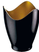
⑪ ワイン・冷酒クーラー 黒金 2948 〈PWI-N2〉 9-1930-1101 ¥3,000 約3ℓ φ200×H254 材質:MS樹脂