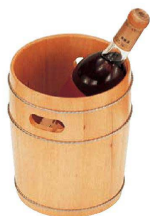
⑭ 木製ワインクーラー DR-711 〈PWI-K2〉 9-1930-1401 ¥14,500 1.5ℓ φ190×H205