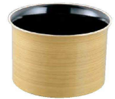
⑨ メラミン 冷酒用クーラー 白木天クリーム 〈PWI-I8〉 9-1930-0901 ¥5,700 φ185×H120