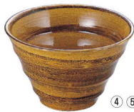
④ 鉛斑点6.0ボール D03-85 〈RBC-A3〉 9-1930-0401 ¥4,300 1ℓ φ187×H113