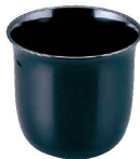
⑩ ワインクーラー 黒(漆) WI-1B 〈PWI-G4〉 9-1930-1001 ¥6,380 2.9ℓ φ176×H167 材質:木質(木粉混合樹脂)