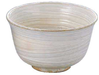
③ 粉引刷毛5.5鉢 D03-77 〈RBC-99〉 9-1930-0301 ¥6,400 0.8ℓ φ165×H100 ●陶器製