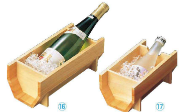
⑯ 白木 ワインクーラー 〈PWI-97〉 9-1930-1601 ¥9,600 280×120×H100