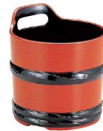
⑧ メラミン 桶ワインクーラー 朱帯黒 〈PWI-I9〉 9-1930-0801 ¥5,800 φ160×H175