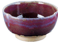
② 辰砂ワインクーラー M-131 〈RMJ-34〉 9-1930-0201 ¥15,500 φ245×H125 ●陶器製