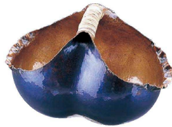
① 銅 紫双胴ワインクーラー (2本入用) SG015 約3週間 〈PWI-K0〉 9-1930-0101 ¥370,000 320×190×H220 ※手作りの為、仕上り等に若干の違いが出る場合がございます。