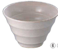
⑥ 粉引6.0ボール D03-86 〈RBC-A4〉 9-1930-0601 ¥4,300 1ℓ φ187×H113