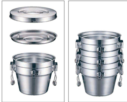
●スタッキング性に優れています。