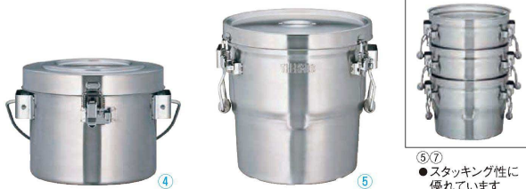
⑥⑦ ●スタッキング性に優れています