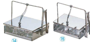
14 ガラス 薬味入れ T-4 (4ヶ仕切) 〈PYK-12〉 9-1986-1401 ¥9,650 145×105×H120 ※ Tong付