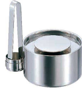
2 モリブデン ガリ・薬味入れ ( Tong付 ) MR-495 〈PGL-65〉 9-1986-0201 ¥4,000 100×133×H63 400cc. ●フタは18-8ステンレスです。 ● Tongスタンドは外れます。