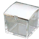
7 ガラス 薬味入れ No.871 〈PYK-27〉 9-1986-0701 ¥3,000 78×78×H70