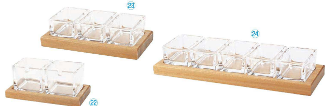
22 ガラス薬味入れ No.672 〈PYK-37〉 9-1986-2201 ¥6,200 180×97×H78 ガラス伸子:75×75×H65