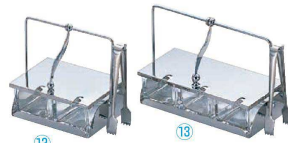
12 ガラス 薬味入れ T-2 (2ヶ仕切) 〈PYK-10〉 9-1986-1201 ¥6,750 107×72×H108 ※ Tong付