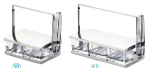
10 ガラス 薬味入れ No.825 (2ヶ仕切) 〈PYK-17〉 9-1986-1001 ¥5,500 135×80×H111 ※ Tong付