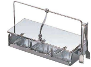
16 ガラス 薬味入れ T-103 (3ヶ仕切) 〈PYK-14〉 9-1986-1601 ¥9,400 183×85×H113 ※ Tong付