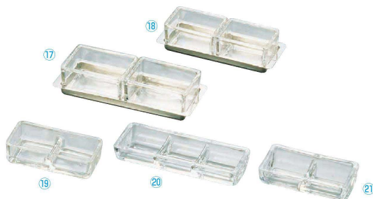
17 ガラス 薬味入れ T-21 〈PYK-04〉 9-1986-1701 ¥3,200 175×70×H39