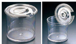
① Ω ポリカーボネイト スパイスポット(目盛付) <ASP-23>