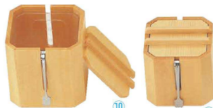
⑩ 木製がり入れ大 (中子・トング付) W-708 <PGL-62> 9-1987-1001 ¥12,400 123×123×H123