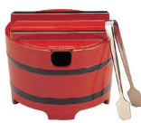
⑯ A(桶) 桶型ガリ入れ 朱帯黒(切込有) <RGL-56> 9-1987-1601 ¥1,600 φ108×H83 ※写真のトングは別売です。