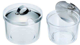
③ UK 丸型薬味入れ <AYK-92>