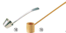
⑱ Ω 18-8 ライラック ソース杓子 <PSC-36>