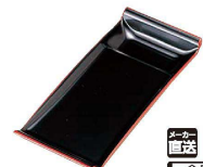
㉔ ABS製 のり皿 黒天朱 <RNL-03> 9-1987-2401 ¥1,000 178×80×H22 ※メーカーより直送になります。