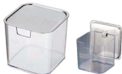
⑨ UK 薬味入れ フック付蓋仕様 <QTY-34>