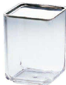
⑤ UK 薬味入れ C <AYK-75>