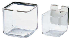
⑥ UK 薬味入れ C(蓋切り込み入) <AYK-76>