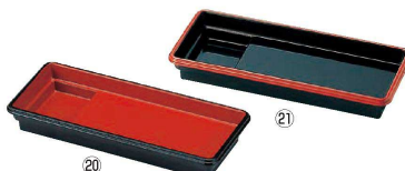
⑳ ABS製 のり皿(タレ付) 朱天黒 <RFI-23> 9-1987-2001 ¥950 178×73×H25