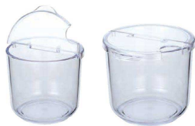
② UK 丸キッチンポット 割蓋付 <PKT-D6>

●フタに切り込みが入っているのでヤクミンングやスプーン等をセットしたままフタができます。 ●フタは引っ掛けつきですので置き場に困りません。