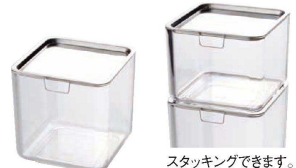
④ UK 薬味入れ スタッキング <AYK-93>