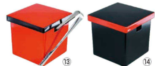
A(元) 元禄ガリ入(小) 朱刈黒 <RFK-E8> 9-1987-1301 ¥1,850 100×100×H100