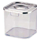
⑦ UK 薬味入れ 角キッチンポット蓋仕様 <QTY-33>