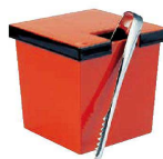
⑫ A(福) 角ガリ入朱刈黒 <RFK-F0> 9-1987-1201 ¥2,700 120×120×H116