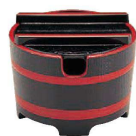
⑮ A(桶) 桶型ガリ入れ 黒木目天朱(切込有) <RGL-55> 9-1987-1501 ¥1,600 φ108×H83