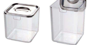
⑧ UK 薬味入れ <AYK-84>