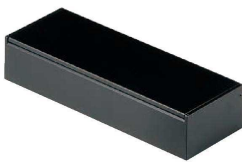
8 ABS製 箸箱 葵 黒 M11-155 〈RHS-Q5〉 9-1994-0801 ¥3,750 252×88×H51 内241×78×H40 ●23cmまでの箸が入ります。