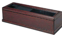
9 ABS製 元禄箸箱 チーク(ヨージ入付) 〈RHS-48〉 9-1994-0901 ¥4,800 288×100×H75 内218×80