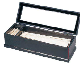
10 ABS製 元禄箸箱 黒(ヨージ入付) 〈RHS-47〉 9-1994-1001 ¥3,200 288×100×H75 内218×80