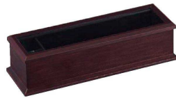
13 消溜 〈RHS-P9〉 9-1994-1301 ¥4,000 320×105×H80 内250×80 ●24cmまでの箸が入ります。