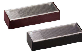
7 ABS製 干筋スリム型 箸箱(アクリル蓋) 〈RHS-R7〉 9-1994-0701 新溜 ¥5,750 9-1994-0702 黒 ¥5,500 248×87×H51 内240×74×H41 ●クリーンフード付