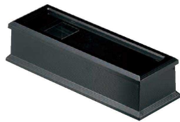
5 ABS製 箸箱 黒(楊枝入付) M10-977 〈RHS-Q4〉 9-1994-0501 ¥4,500 287×100×H70 内231×70×H50 ●22.5cmまでの箸が入ります。