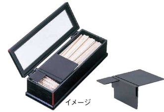
11 元禄箸箱用 クリーンフード(ポリプロピレン) 〈RHS-49〉 9-1994-1101 ¥480 127×81×H54 ●箸・ヨージの先端に直接手が触れるのを防ぎます。