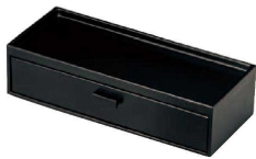
1 ABS製 箸箱・カスター 黒 M10-975 〈RHS-Q3〉 9-1994-0101 ¥4,150 250×105×H65 カスター部 内240×95 引き出し部 内235×90×H40 ●23cmまでの箸が入ります。