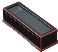
6 ABS製 ニュー箸箱 黒(楊枝入付) 〈RHS-53〉 9-1994-0601 ¥3,200 275×100×H72 内218×80×H53 ●蓋が途中で止まります。