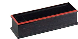
12 ABS製 24cm元禄箸箱(楊枝入付) 黒(朱) 〈RHS-Q0〉 9-1994-1201 ¥4,000 320×105×H80 内250×80 ●24cmまでの箸が入ります。