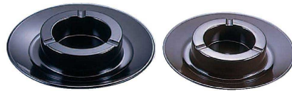
⑪ メラミン 大型灰皿 (PHI-D3) 洗 (耐熱120℃) 黒 チョコ サイズ 542L 9-2006-1101 9-2006-1102 φ227×H52 ¥1,430 542S 9-2006-1103 9-2006-1104 φ200×H46 ¥1,200