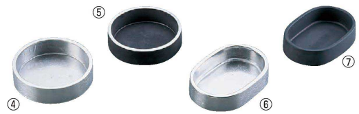
アルミダイキャスト灰皿 ④ AL1010M-1 丸型 (PHI-B8) 9-2006-0401 ¥1,800 φ100×H28 ⑤ AL1010M-6 丸型 黒 (PHI-B9) 9-2006-0501 ¥2,000 φ100×H28 ⑥ AL1020M-1 小判型 (PHI-C0) 9-2006-0601 ¥1,800 110×77×H28 ⑦ AL1020M-2 小判型 黒 (PHI-C1) 9-2006-0701 ¥2,000 110×77×H28