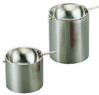
① 18-8 回転灰皿 (PKI-08) 9-2006-0101 大 φ85×H100 ¥5,200 9-2006-0102 小 φ75×H 65 ¥4,500