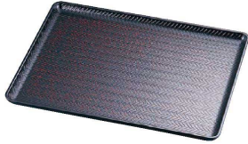
① □耐熱 網代盆 曙(ノンスリップ加工)洗 (EBV-08)

□耐熱ABS樹脂(耐熱温度約100℃ 洗浄機使用可能) 耐久性に優れ衝撃に強く割れにくい。塗料の密着も良好。