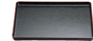
④ □大寿木目盆 黒天朱 (RBV-H9) □