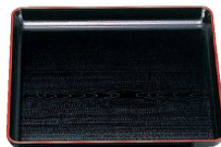
⑨ □新木目角盆 黒天朱 (RBV-24) □