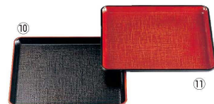
⑩ □8寸角盆 黒布目天朱 (ノンスリップ加工) (RBV-G9) □