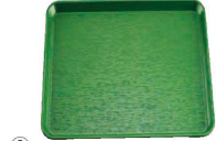
③ 耐熱 波筋盆 33cm(ノンスリップ加工)洗 EP-3300(EBV-09)