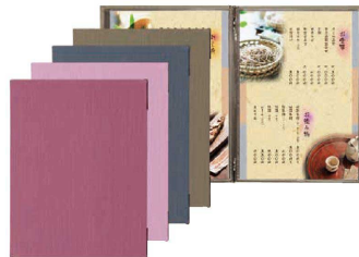
⑥ シンビメニューブック PR-401 (PAA-C7) 目 ¥2,700