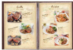
① シンビメニューブック TPE-301 (PMB-28) 目 ¥3,300