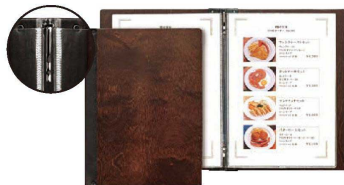
⑦ シンビ木製メニューブック SHO-101