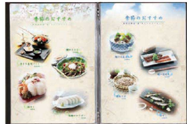
③ シンビメニューブック TPE-305 (PMB-30) 目