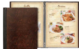
⑨ シンビ木製メニューブック SHO-105