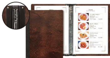
⑩ シンビ木製メニューブック スリム-B・SHO-101