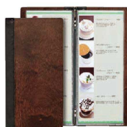
⑧ シンビ木製メニューブック SHO-103