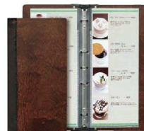
⑪ シンビ木製メニューブック スリム-B・SHO-103