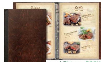
⑫ シンビ木製メニューブック スリム-B・SHO-105