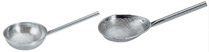
③ UK 18-8パンチング丸型スクイ玉揚 〈ASK-56〉 9-0206-0301 ¥14,700 φ270×全長620×深さ100 パンチング穴径:2.2