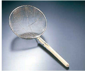
① 18-8丸型 スクイ玉揚 (6.5メッシュ) 〈ASK-10〉 9-0206-0101 ¥5,500 (A) (B) (C) 深さ 620×270×270×100