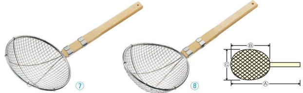
TS ステンレス 極荒すくい網 ⑦ 丸型 24cm (18-8アミ・2.5メッシュ) 〈ASK-38〉目 9-0206-0701 ¥4,900 φ240×全長590×深さ60