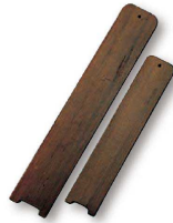
5 焼杉メニュー札 〈PMN-T7〉 9-2060-0501 特大 75×450 ¥900 9-2060-0502 大 65×390 ¥630 9-2060-0503 中 60×330 ¥560 9-2060-0504 小 50×240 ¥430