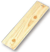
1 桜風ねたプレート EN-1 〈PNT-Q9〉 9-2060-0101 ¥210 60×250 材質:エンビ製 表面木目調シール貼