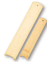
6 白木連札 〈PMN-T8〉 9-2060-0601 特大 80×450 ¥1,300 9-2060-0602 大 70×400 ¥1,050 9-2060-0603 中 55×320 ¥850 9-2060-0604 小 50×280 ¥700