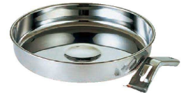
⑧ MA 18-0 ハンドル付 すきやき鍋 (QSK-32)