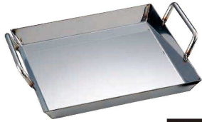
① 18-0 チリトリ鍋 (QTL-52)