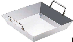
③ 18-0 チリトリ鍋 深型 (QTL-60)