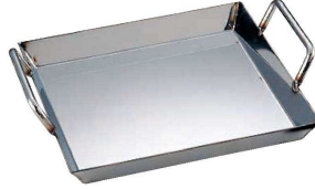
② 18-0 チリトリ鍋 (足付) (QTL-58)