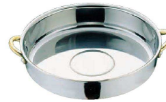
⑦ MA 18-0 両手付 すきやき鍋 (QSK-33)