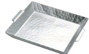
⑤ アルミ 槌目付角ナベ (QNB-29)