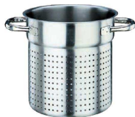
⑩ パデルノ 18-10 スチームポット 1123 (AST-F5)