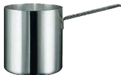
⑪ パデルノ 18-10 バンマリーポット 1910 (ABV-84)