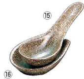
⑮ 新緑ビードロレンゲ T03-229 〈RLV-K2〉 9-2100-1501 ¥1,400 130×45