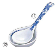
⑪ 染付唐草 大スプーン T05-79 〈RLV-J0〉 9-2100-1101 ¥3,800 140×38