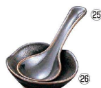
㉕ 柚子天目 小レンゲ T03-239 〈RLV-L2〉 9-2100-2501 ¥2,000 158×55