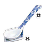
⑬ 染付唐草 小スプーン T05-81 〈RLV-J2〉 9-2100-1301 ¥3,300 135×30