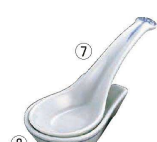
⑦ 新唐草レンゲ T05-75 〈RLV-I6〉 9-2100-0701 ¥2,500 140×48