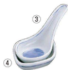
③ 線彫レンゲ T05-71 〈RLV-I2〉 9-2100-0301 ¥3,000 125×53