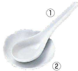
① 白磁ミニレンゲ T03-257 〈RLV-M9〉 9-2100-0101 ¥620 110×30