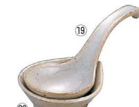
⑲ カンゲン 大レンゲ T03-233 〈RLV-K6〉 9-2100-1901 ¥1,500 203×76