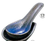
⑰ 伊賀るりレンゲ T03-231 〈RLV-K4〉 9-2100-1701 ¥1,400 130×45