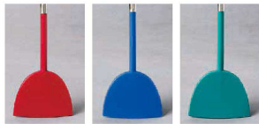
材質：ヘラ部/シリコン 柄部/18-8ステンレス 耐熱温度：-40～+250℃