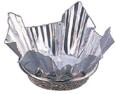
① アルミ すき鍋 (銀) M33-246 (100枚入) (QSK-A7) 9-2112-0101 ¥4,500 入販 230 × 230 ※写真の受網は別売です。