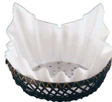
⑦ 奉書 角 (300枚入) 入販 底径 9-2112-0701 M33-266 340×340 φ150 ¥21,900 9-2112-0702 M33-267 400×400 φ170 ¥25,200 ※写真の竹製受籠・発熱板は別売です。