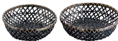
⑨ 竹製 受籠 (QUK-07) 9-2112-0901 M40-850 φ240 ¥2,200 9-2112-0902 M40-851 φ270 ¥2,420