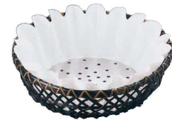
⑧ 奉書 花 (300枚入) 入販 底径 9-2112-0801 M33-268 φ330 φ150 ¥28,200 9-2112-0802 M33-269 φ390 φ170 ¥31,500 ※写真の竹製受籠・発熱板は別売です。