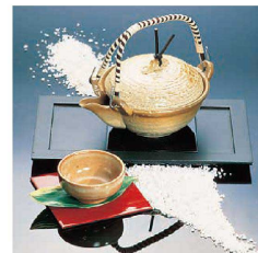
18 アルミ片口鍋 幸楽 (陶器 千代口付) 〈QKT-03〉 9-2118-1801 ¥5,700 12cm 内径98×深さ40 容量:230c.c.