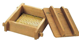
2 ネズコ 角セイロ 〈QSI-09〉 9-2118-0201 ¥3,900 内123×123×H38 ●蓋・すだれ付