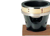
10 一人用丸型 湯葉鍋 (水入・木柵付) 〈QYB-04〉 9-2118-1001 ¥9,900 φ150×H60 内φ120×H53 ※コンロ・敷板は別売です。 P.2110②やまと鍋コンロセット小を御使用下さい。