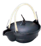
16 アルミ 土瓶 黒大 M10-241 〈QDB-03〉 9-2118-1602 ¥5,170 例150×深さ55 0.5ℓ 0.52kg 材質:アルミ合金