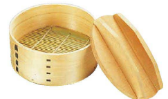
4 桜 丸セイロ 〈QSI-17〉 9-2118-0401 ¥5,000 内φ130×H45 ●蓋・すだれ付