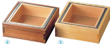
8 電調焼杉柵 湯葉鍋 〈QYB-02〉 9-2118-0801 ¥25,800 243×230×H80 内183×169×H65 ●2~4人用