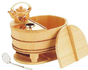
14 サワラ小判型 湯ドーフセット (炭用) 〈QYD-03〉 9-2118-1401 US-1022 2人用 270×208×H180 ¥72,000 9-2118-1402 US-1023 3人用 285×215×H190 ¥82,000 9-2118-1403 US-1025 4~5人用 305×235×H190 ¥71,460