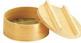
3 桜 ワッパセイロ 〈QSI-11〉 9-2118-0301 ¥4,600 内φ140×H42 ●蓋・すだれ付