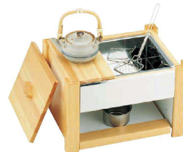
11 白木湯豆腐セット (固形燃料用) CW-403 〈QYD-13〉 9-2118-1101 ¥33,000 245×185×H165