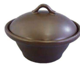
5 萬来鍋 丸型 こげ茶 (蒸気二重鍋方式) 〈QNB-20〉 9-2118-0501 大 (2~4人前用) ¥6,300 外鍋φ225×H140 1,200c.c. 内鍋φ175×H 45 500c.c. 9-2118-0502 小 (1人前用) ¥4,200 外鍋φ165×H110 450c.c. 内鍋φ125×H 40 200c.c.