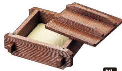
1 せいろ蒸しセット 中洗 ライトブラウン M44-141 (ポリプロピレン) 〈QSI-63〉 9-2118-0101 ¥3,650 183×183×H90