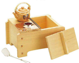
13 桜角型 湯ドーフセット (炭用) UH1021 〈QYD-04〉 9-2118-1301 ¥65,000 1人用 250×183×H145