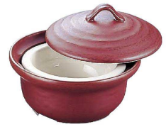
7 うるわし 萬来鍋 赤 〈QNB-25〉 9-2118-0701 ¥4,000 外鍋 φ160×H72 内鍋 φ127×H44 材質:陶磁器 ●豆腐や茶碗蒸し等が短時間でムラなくできます。 ●蒸し物全般、温野菜、目玉焼き、料理の温めなおし、冷凍食品の調理等幅広く利用できます。