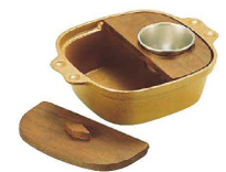
15 アルミ ゆどうぶ鍋 (茶・2枚フタ・仲子付) 〈QYD-02〉 9-2118-1501 ¥6,000 15cm 160×160×H45