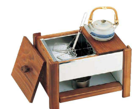
12 ネズコ湯豆腐セット (固形燃料用) CN-405 〈QYD-14〉 9-2118-1201 ¥33,000 245×185×H165