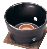
6 萬来鍋用コンロ 〈QNB-56〉 9-2118-0601 大 φ180×H105 ¥5,300 9-2118-0602 小 φ132×H 97 ¥3,300 材質:陶器 ●敷板、火皿付 ※⑤萬来鍋 丸型 こげ茶専用コンロです。

材質:外鍋/耐熱セラミック製 内鍋/磁器 ●1つあれば蒸し鍋のほか炒め、煮込みと幅広くご使用できます。 ●ガスコンロ、オープン、電子レンジでもご使用できます。